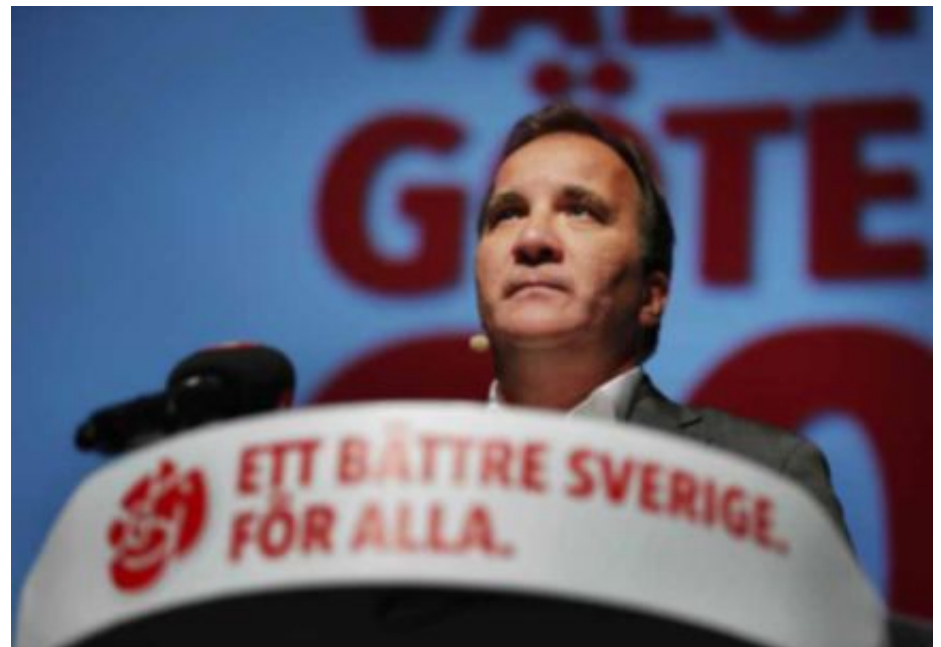
Stefan Löfven tror att partiets 90-dagarsgaranti för unga ska ge resultat mot arbetslösheten.

– Vi har ett mycket bättre upplägg. Vi lägger till